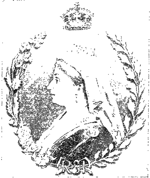
स्वर्गवासिनी महारानी विक्टोरिया ।